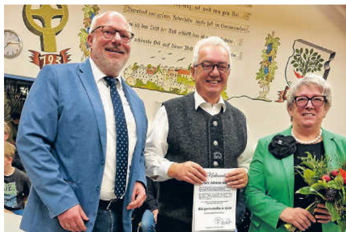
Verleihung der Bürgermedaille in Gold