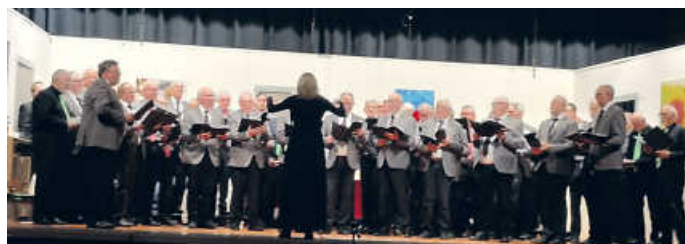
Drei Chöre gemeinsam

Die Liederkranz-Bar und natürlich die flotte Tanzmusik von „Just for fun“ rundeten den Abend zu einem gelungenen Ganzen.