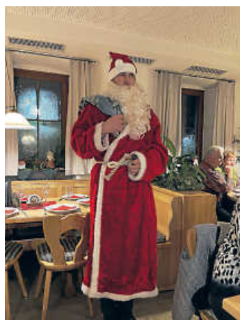
Besuch des Weihnachtsmanns in

Rund 50 SCK-Mitglieder haben das Jahr bei der SCK-Winterfeier am 20. Dezember ausklingen lassen. In der Alten Brauerei in Bönningheim lies man es sich bei schwäbischen Leckereien und Weihnachtsliedern gutgehen. Eine besondere Überraschung war der Besuch des Weihnachtsmanns, der auch die Liederbücher für die Weihnachtslieder dabei hatte. Eine weitere Bescherung gab es auch für die Sommer- und Winterübungsleiter, bei denen man sich für den tollen Einsatz im vergangenen Jahr bedankt hat.