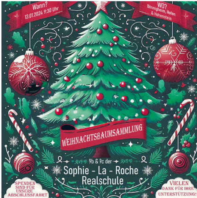
Bild: Sophie La Roche-Realschule