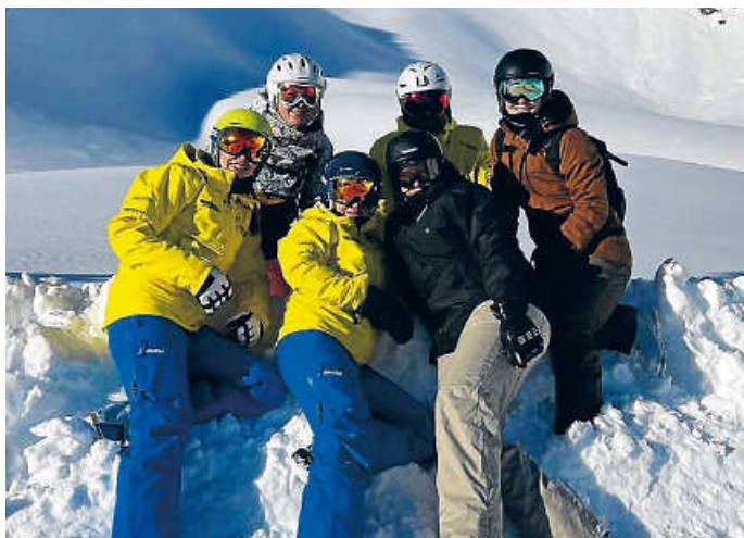
Kaiserwetter in Sölden