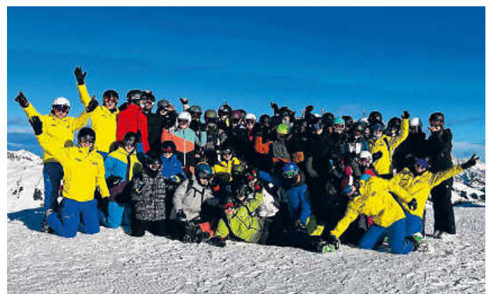
Jugendcamp in Saalbach