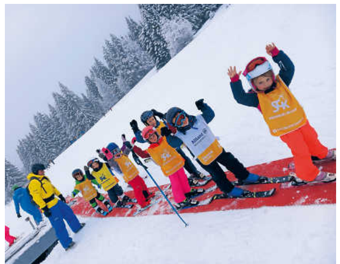
Gute Stimmung bei den Allgäukursen an 3-König

Nach dem gelungenen Saisonstart stehen noch zahlreiche abwechslungsreiche Tages- und Mehrtagesfahrten ins Zillertal, Stubaital, Allgäu, nach Oberstdorf, Söll oder Kitzbühel auf dem Programm. Am kommenden Wochenende werden die ausgefallenen Weihnachtskurse nachgeholt. Die Anmeldung erfolgt über die Internetseite des SCK, dort ist auch das gesamte Programm zu finden: https://skiclub-kirchheim.de/veranstaltungen