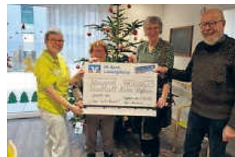
Übergabe der Spende