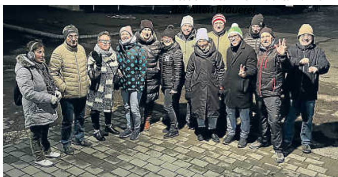
14 Wanderer sind von Kirchheim zur Winterfeier gewandert und mit einer flüssigen Belohnung gut angekommen