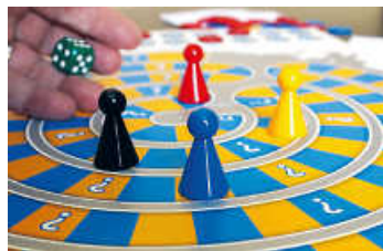
Jede Woche laden wir ein zum Spieleabend in der Storchenkelter

Beim Kartenspiel Typo werden durch geschicktes Anlegen Worte so lange wie möglich verlängert.